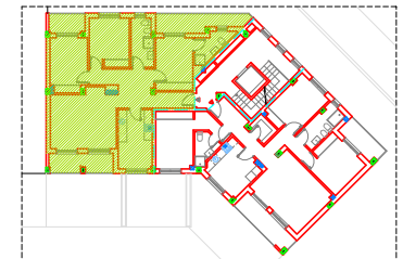
IDENTIFICACION DE VIVIENDA EN PLANTA PRIMERA